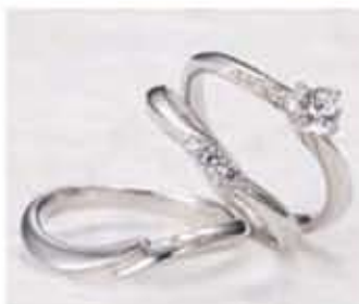
ダイヤモンドのアレンジで変わる。個性を発揮できる新作セット。