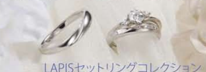
LAPISセットリングコレクション