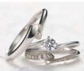
並行するウェーブラインがびったり。ダイヤモンドをゴージャスに。